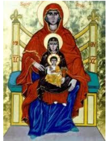
Sint Anna te Drieën

Preek: (om over na te denken!) Waarom staat er in de Hebreeuwse Bijbel: "Er geschiedde een man" en zie je in de vertalingen deze zin (bijna) nergens terug?? Terwijl toch in het woord "geschieden" dezelfde letters staan als in de Godsnaam JHWH!